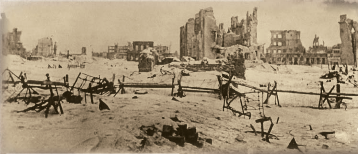
Stalingrad v den kapitulace obklíčené německé 6. armády 2. února 1943.

Naopak Sověti stáli na prahu éry řetězovitých vítězství , která měla již brzy po Stalingradu následovat. Sovětské ozbrojené síly sice od