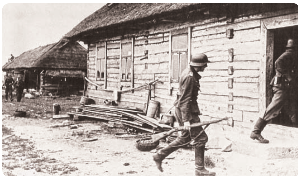
Němci během bojů o jednu z mnoha ruských vesnic v červnu 1943.