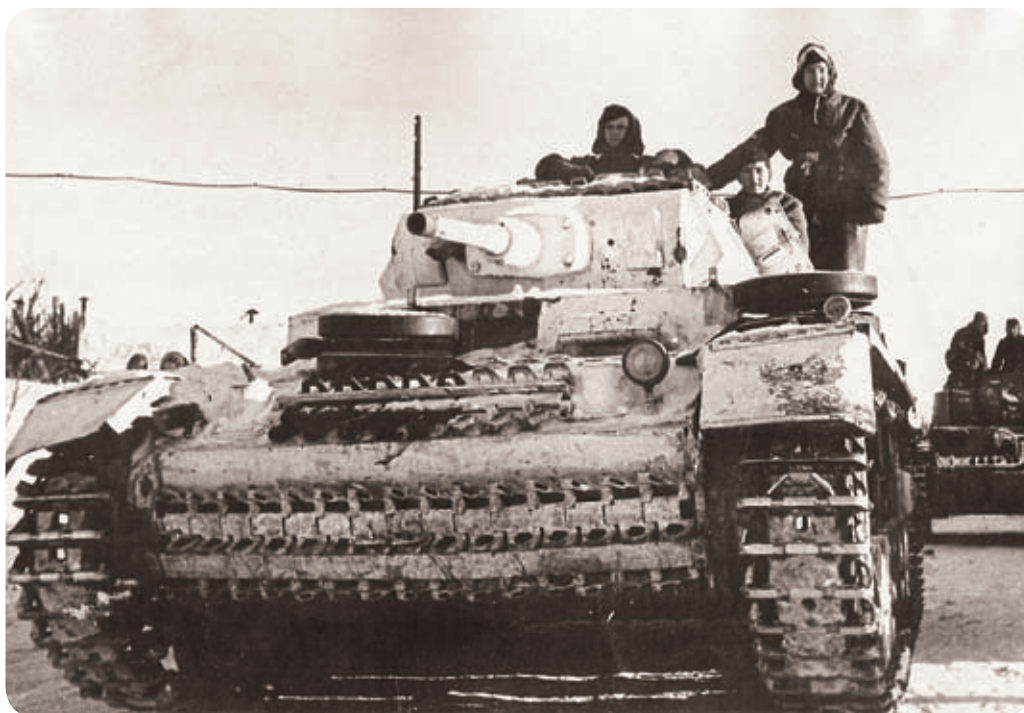
Německé těžké tanky ještě se zimní kamufláží na východní frontě v dubnu 1943.