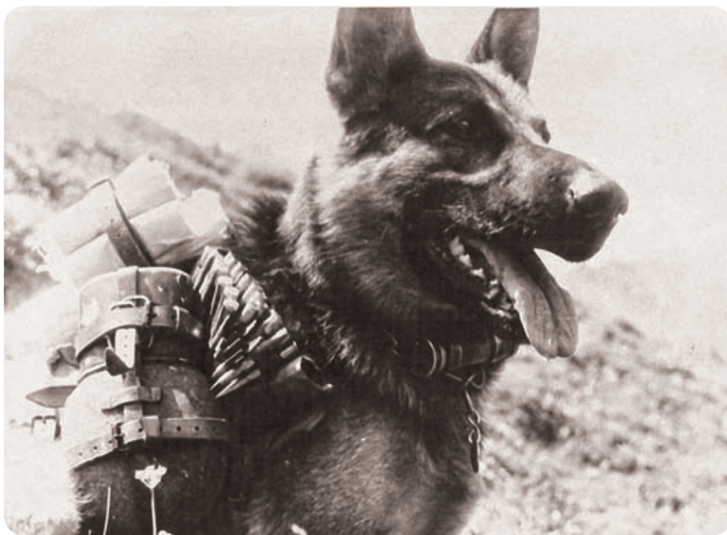
Speciálně vycvičení psi zásobili německé hlídky v prvních liniích střelivem, poštou i jídlem. Snímek vznikl na neznámém úseku východní fronty 23. února 1943.