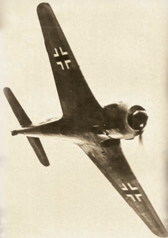
Jednomístná německá stíhačka Fw 190 operující nad východní frontou. Němci během války vyrobili 20 000 těchto mezi letci oblíbených strojů.

Na místo nezávislé Ukrajiny vznikl na Hitlerův příkaz 16. července 1941 (tj. již tři týdny po invazi) Říšský komisariát Ukrajina ( Reichskommissariat Ukraine ) v čele s říšským komisařem (správcem) Erichem Kochem , v prvním