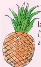
la piña [pi ña] ananas