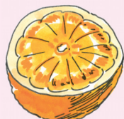
la naranja [na 'ran xa] pomeranč