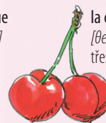
la cereza [θe 're θa] třešně