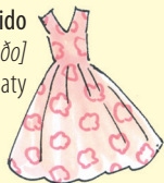
el vestido [βes 'ti ðo] šaty