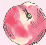
el melocotón [me lo ko 'ton] broskev