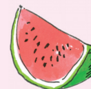
el melón [me 'lon] meloun