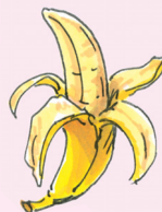
la banana [βa 'na na] banán