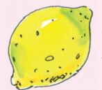
el limón [li 'mon] citron