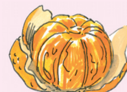
la mandarina [maN da 'ri na] mandarinka