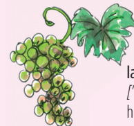
la uva [w βa] hroznové víno