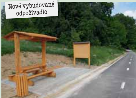
Nově vybudované odpočívadlo

Abyste se mohli vydat společně s tokem řeky Jihlavy z kopce, začněte tento výlet v Okříškách . Od zdejšího nádraží vyjedte vlevo společně se žlutou značkou, ale v zatáčce opusťte hlavní a pokračujte přímo dolů ulicí Partyzánskou. Po ní sjedete do Petrovic, kde se napojíte na mezinárodní CT 26 Jihlava–Raabs . Střídavě po velmi kvalitních cyklostezkách, které se vlní paralelně s řekou Jihlavou, se kolem několika mlýnů a obce Sokolí (s možností k občerstvení) velice pohodlně a především bezpečně dostanete do unikátního města Třebíče . Cyklotrasa vede střídavě společně s červenou TZ. Značení CT 26 není zcela dokonalé, proto je dobré se občas poradit s mapou, ale v zásadě budete sledovat tok Jihlavy. Trasa se občas vzdaluje a stoupá i nad ni, a pak se nabízí pozoruhodné výhledy. Další odměnou vám budou dlouhé sjezdy, především u obce Sokolí. Působivý je pak vjezd do Třebíče po krásné upraveném nábřeží s výhledem na baziliku sv. Prokopa a židovskou čtvrť na opačném břehu. Nyní zbývá ještě prohlídka všech zdejších zajímavostí: pozoruhodná je zejména zástavba v židovské čtvrti a židovský hřbitov na kopci nad městem.