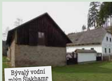
Bývalý vodní mlýn Šlakhamr

Zaniklá železniční trať → Poslední jízda se na této trati uskutečnila v roce 2006, pak již následovala demontáž kolejnic. Výstavba cyklostezky o délce necelých 9 km byla dokončena v červenci 2011. Bylo zde vybudováno devět lávek, dvě odpočívadla a necelé dva kilometry zábradlí.