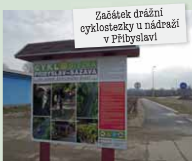
Začátek drážní cyklostezky u nádraží v Příbyslaví

Zaniklá železniční trať → Poslední jízda se na této trati uskutečnila v roce 2006, pak již následovala demontáž kolejnic. Výstavba cyklostezky o délce necelých 9 km byla dokončena v červenci 2011. Bylo zde vybudováno devět lávek, dvě odpočívadla a necelé dva kilometry zábradlí.