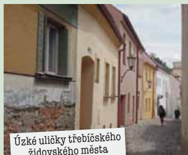
Úzké uličky třebíčského židovského města