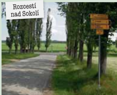
Rozcestí nad Sokolí

Okříšky → Od roku 2007 jsou Okříšky městem. Obec je písemně připomínána k roku 1371, ale její existence se jistě datuje ještě dále do minulosti. Největší zdejší pamětihodností je kostel Jména Panny Marie s nejasným původem.