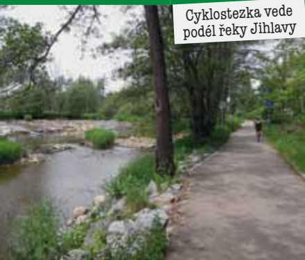
Cyklostezka vede podél řeky Jihlavy

Pojedete po cyklostezce, která se bude vlnit společně s řekou Jihlavou. Na necelých 14 km se s auty setkáte jen minimálně a na trase vás čeká pouze jedno větší stoupání.