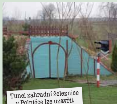
Tunel zahradní železnice v Polníčce lze uzavřít