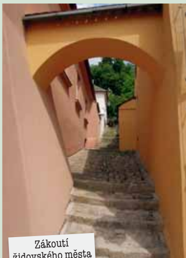
Zákoutí židovského města