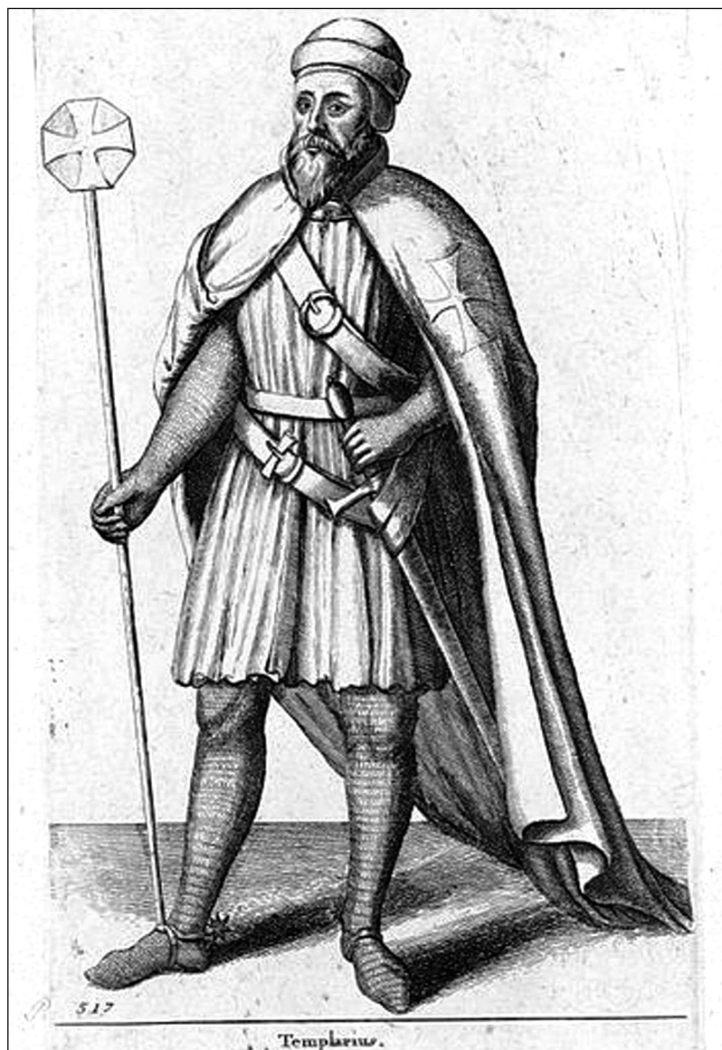
Václav Hollar (1607-1677): Velmistř templářů. Nedatovaná rytina z archivu univerzity v Torontu