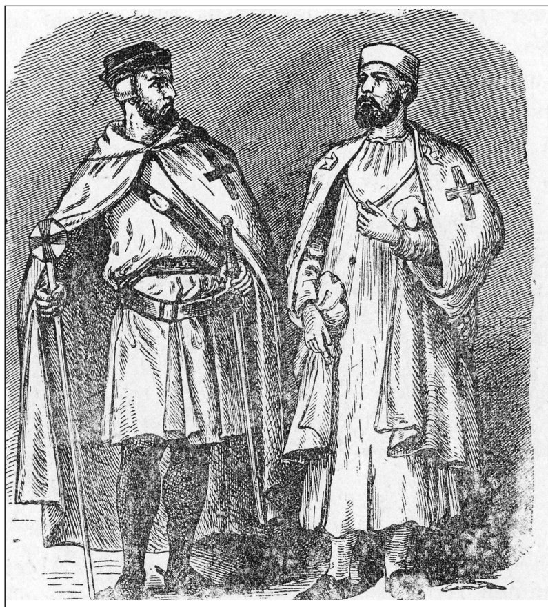
Templářští rytíři. Kresba v romantickém pojetí 19. století

Když křížové výpravy skončily, velmistr Jacques de Molay přesídlil do Francie, kde měli templáři nejvíce statků. Jejich střediskem se stal palác Temple v Paříži, v okolí žili služebníci řádu, jeho přátelé a sympatizanti. Vznikla městská čtvrť, která tvořila celou třetinu tehdejší Paříže. Řádové domy měly právo azylu, čehož využil král Filip Sličný roku 1306, když ho pronásledoval