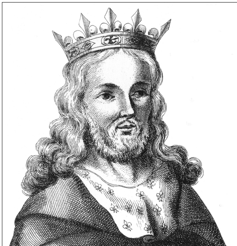
Král Filip IV. Sličný (1268–1314)

byli příliš důvěřiví, ale také hrdí a před králem nic neskrývali. Pravděpodobně tehdy Filipa Sličného ovládlo pokušení. Měl sice mnoho peněz, ale potřeboval víc. Vítězství u Mons-en Puelle ho přivedlo málem na mizinu, byl donucen vzdát se vlámské části Flander, musel odvolat nové daně, proti kterým se bouřili poddaní v Normandii, Židé už byli ze země vyhnáni. Majetek templářů se mu takřka přímo nabízel, navíc krále dráždili tím, že tvořili