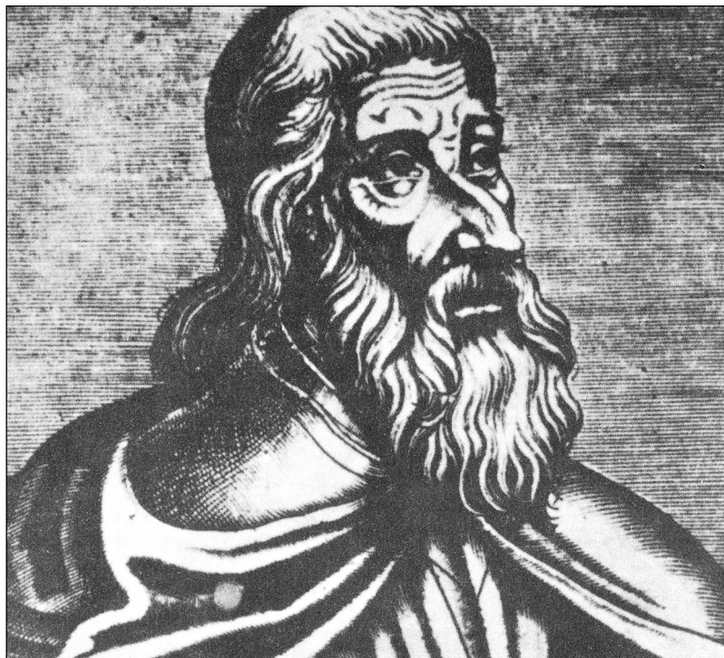
Velmistr Jacques de Molay (1243/4–1314)

V pátek 13. října 1307 byl velmistr Jacques de Molay zatčen a s ním sto čtyřicet templářů, kteří právě dleli v Paříži. Další desítky pozatýkali v celé Francii. Úder to nebyl nečekaný, a templáři