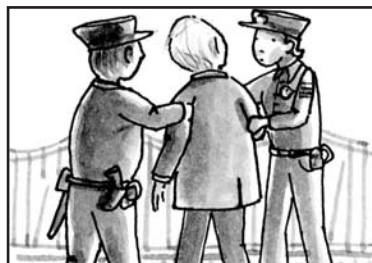
Policisté odvádějí Protivu

„A do té doby bude chlapec v bezpečí strašilovského sirotčince,“ řekl Brambora.