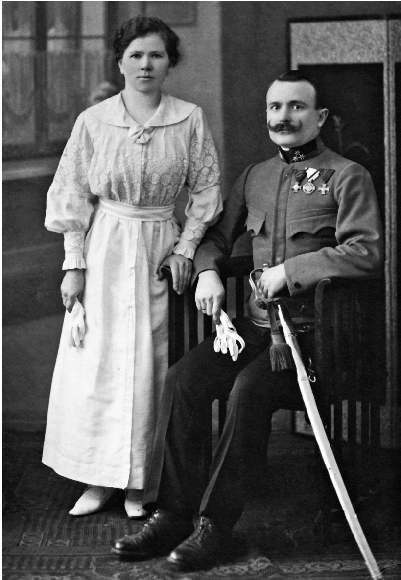
Mladí manželé v Sarajevu v roce 1918