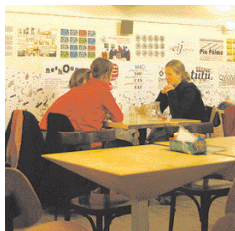
DER WIENER DEEWAN