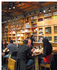
CUINES DE SANTA CATERINA