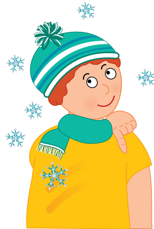
Záda — prstem ukážeme na záda.