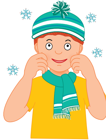
Štípe mráz — štípneme se do tváří.

Už je tady zima zas, do tváří nás štípe mráz . Venku sněží, chumelí , nezůstanem v posteli. Budeme si venku hrát, lyžovat a sáňkovat. Venku snížek padá, na hlavu i záda .