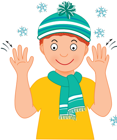
Chumelí — ruce s nataženými prsty dáme před sebe a jejich mírným pohybem napodobíme padání vloček.