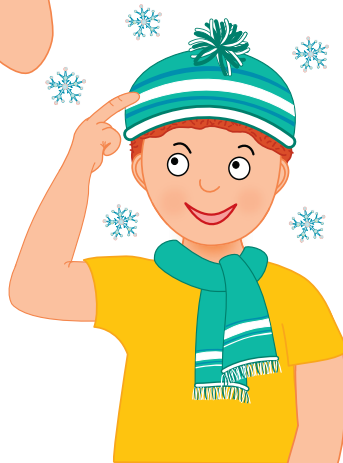
Na hlavu — prstem ukážeme na hlavu.