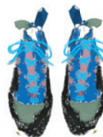
lezečky na suchý zip