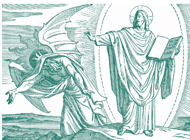
Čerti byli původně andělé...

Čertiska jsou odsouzena k věčnému zatracení v pekle, kam také přivádějí další hříšníky. Najdou si je buď sami, nebo pomocí různých intrik. Tím