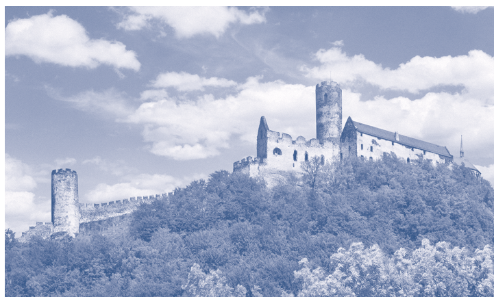
Hrad Bezděz vznikl po Luciferově sázce.

hlínu z Mariina vrchu a liboval si, jak to pěkně pro svého pána zařídil. Jenže ráno, když vyšlo slunce, byla čertova hora o kus menší než ta, kterou stavěla Panna Marie! Čert se ve vzteku vypařil, na potupnou prohru ale dodnes nezapomněl. Toho, kdo ke zřícenině hradu, která stojí na vyšším z vršků, vystoupá na Štědrý den za jitřní mše, stáhne roháč s sebou do pekla.